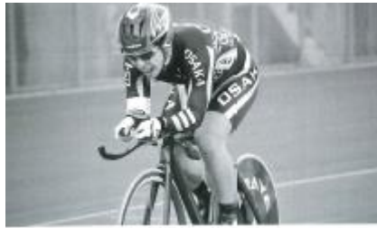
4 km個人パーシュート