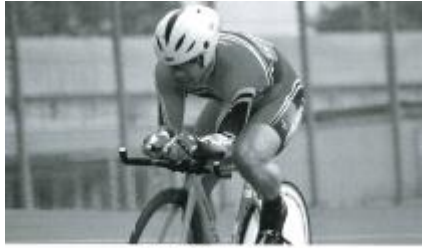
1 kmタイムトライアル