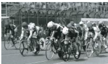
エリミネーションレース