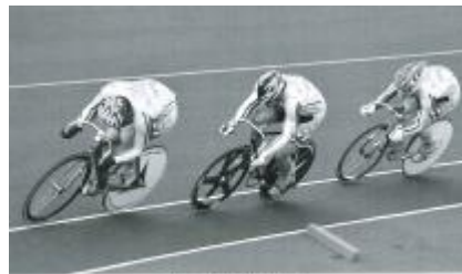
チームスプリント